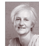
Edda Edzards Sekretariat